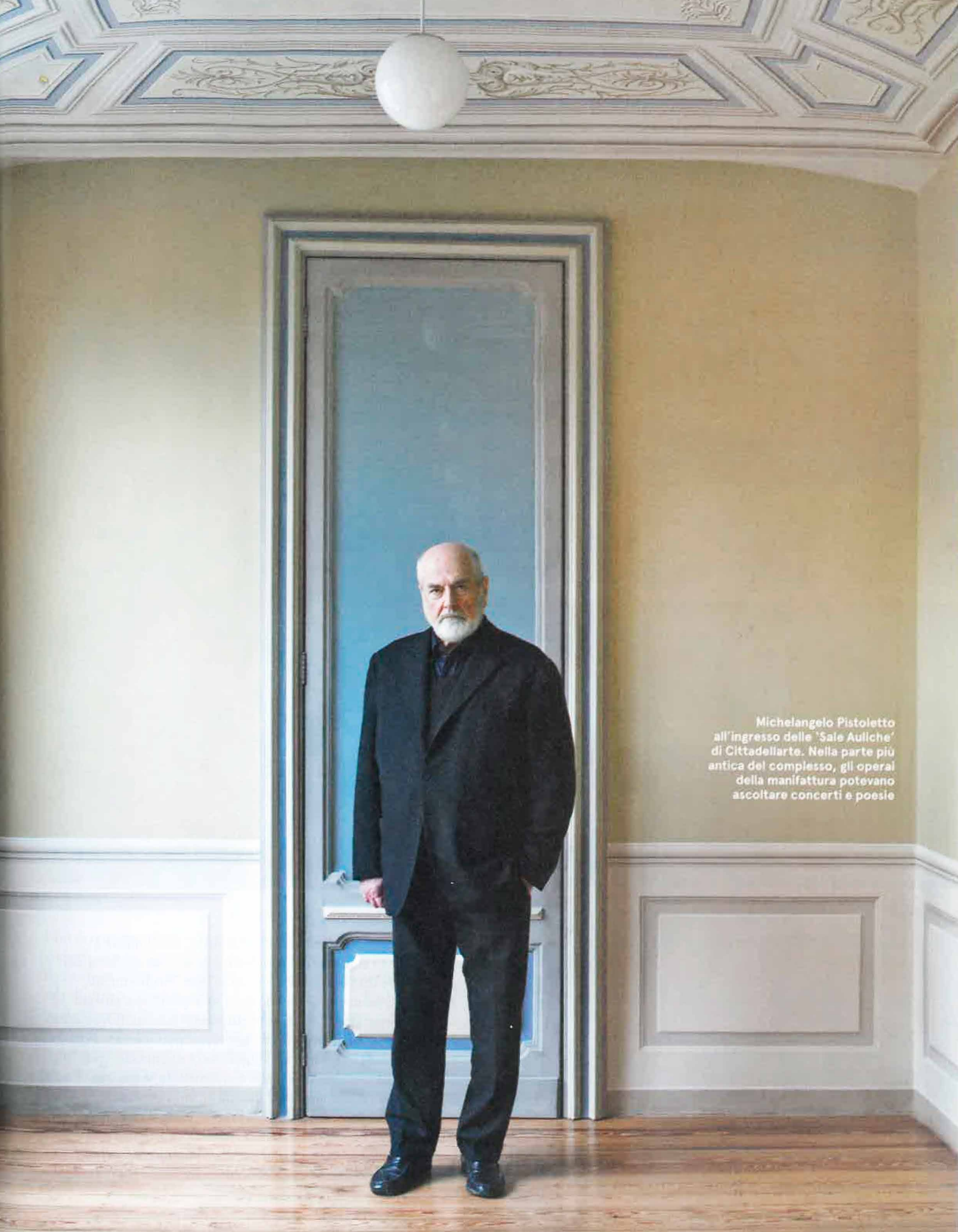
Michelangelo Pistoletto all'ingresso delle 'Sale Auliche' di Cittadellarte. Nella parte più antica del complesso, gli operai della manifattura potevano ascoltare concerti e poesie